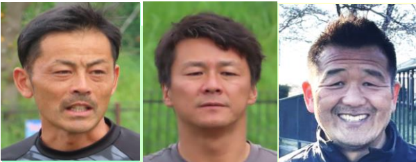
鈴木チューター・青葉チューター 谷口チューター

前回（15回）同様、成田優先枠無しで公募した事もあり、千葉県在住16名（成田地区3名）の他、県外の東京都から3名、茨城県から2名の計21名の参加がありました。