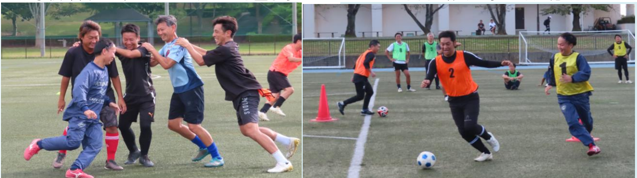
■実技：アイスブレイク（まずは打ち解けましょう） ■実技：テクニック（1対1）