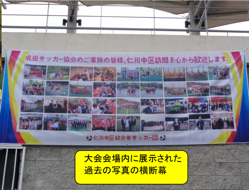
大会会場内に展示された過去の写真の横断幕