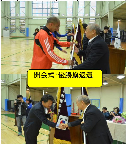
開会式：優勝旗返還