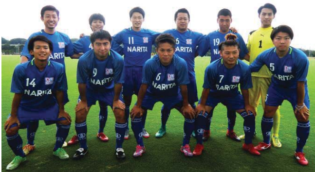
■成田選抜2018、2回戦先発メンバー