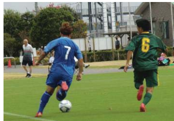
■ 土佐選手の右サイド突破!