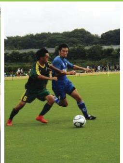
■本田選手の競り合い