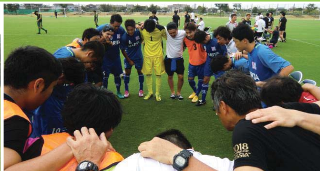
■後半戦前の円陣、ここが踏ん張りどころ