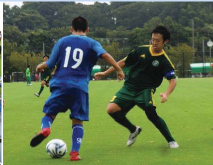
■ 溝口選手パスコースを狙う