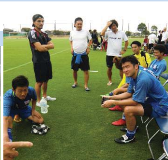
■ ハーフタイムでの指示