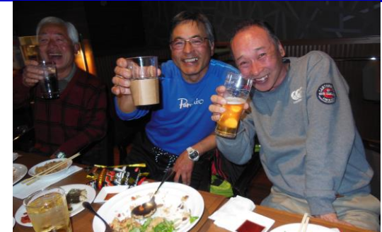
■シニアリーグにまだ未参加の皆さん、来季は是非参加ください。詳しくは市協会事務局 & HPIにて公開します。